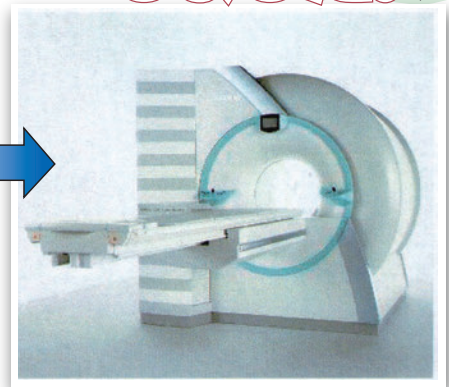
MAGNETOM Symphony, A Tim System

細に描出することができます。トラクトグラフィー(拡散テンソル画像)という神経線維を描出できる撮影や、MR S(スペクトロスコピー)という脳内の細胞の代謝活動を調べる特殊な検査も可能となりました。今回のアップグレードにより、より確実な診断、治療に貢献できることと思われま