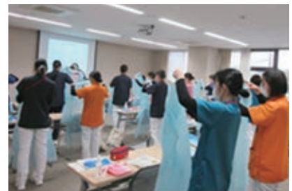
正しい防護具のつけかた